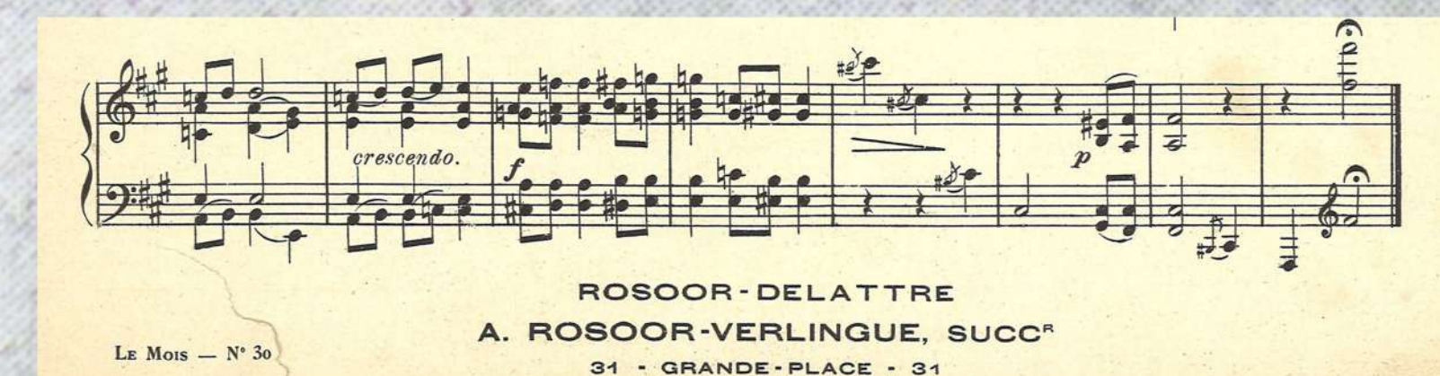
Archives municipales de Tourcoing, 39 Z

Au décès de Jules Rosoor, la maison d'éditions est reprise par son fils Amédée.