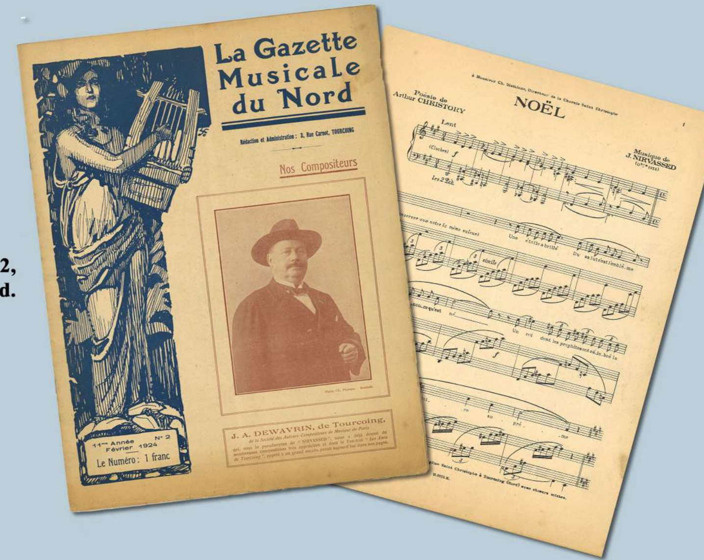
La gazette musicale du Nord, 11 ème année numéro 2, biographie de J.A. Dewavrin alias Nirvassed. Partition d'un chant de Noël composé par Nirvassed, issu du numéro 11, 12 ème année. Archives municipales de Tourcoing. Série Fi, NE.

En 1946, il ouvre un magasin de musique, toujours à Tourcoing, 16 rue de Menin (commerce qu'il cèdera en 1973) dans lequel il investit beaucoup. Parallèlement, il joue à la Radio PTT Nord, il a aussi un orchestre de bal.