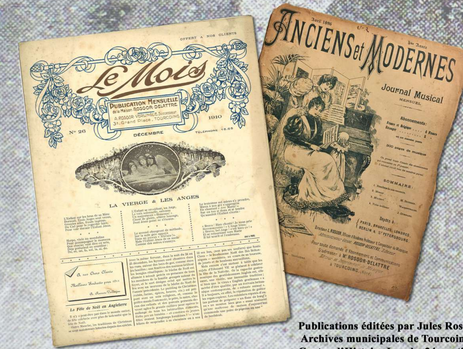
Publications éditées par Jules Rosoor-Delattre. Archives municipales de Tourcoing 39 Z ; Centre d'Histoire Locale. 24-partitions