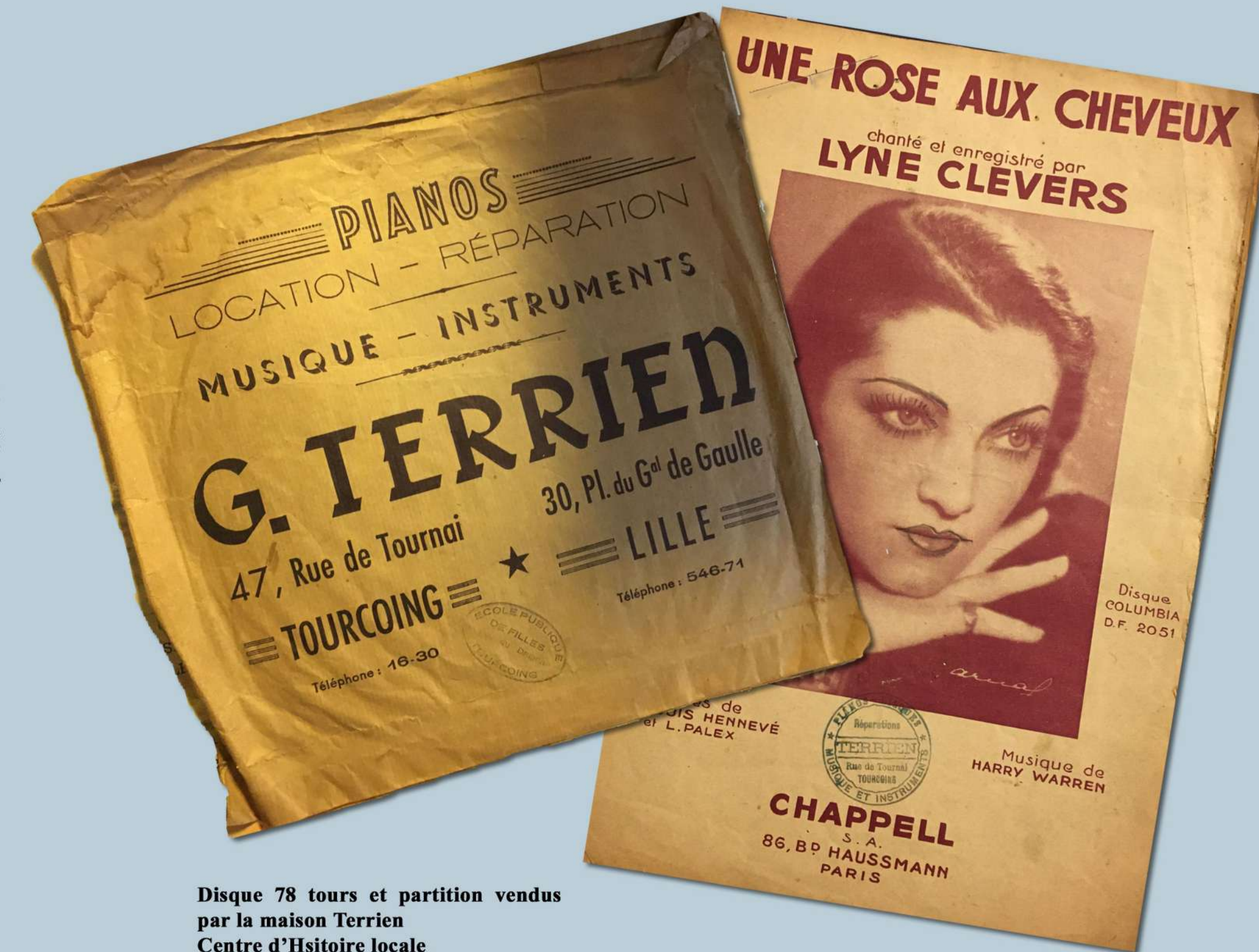
Disque 78 tours et partition vendus par la maison Terrien Centre d'Histoire locale

La maison Terrien vend des partitions mais aussi des tourne-disques, des disques, des pianos, des instruments et en assure la maintenance. Au début des années 1960, Gilbert Terrien quitte Tourcoing et installe son magasin sur la Grand Place de Lille sous l'enseigne « Tout pour la musique ».